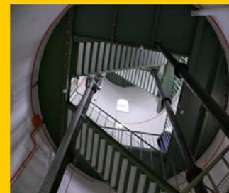
Der Treppenaufgang im inneren des Turmes