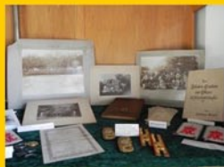
Fotos / Dokumente

In einer weiteren Abteilung werden 3 wechselnde Ausstellungen pro Jahr gezeigt. Ankündigungen dazu sind in der örtlichen Presse oder dem Internet zu entnehmen.