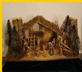
Krippenausstellung ( jedes Jahr wechselnd )