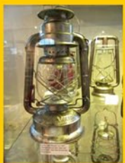
Ausstellung Feuerhand Sturmlaterne