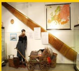
Ausstellung Flucht und Vertreibung