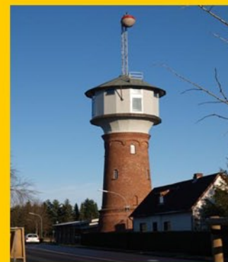
Der Wasserturm heute

Der Wasserturm wurde 1901 fertiggestellt, um eine zentrale Wasserversorgung des Truppenübungsplatzes Lockstedter Lager sicher zu stellen. Er war bis 1984 in Betrieb und steht seit 1983 unter Denkmalschutz. Mit seiner Sanierung 2007 erhielt die Öffentlichkeit die Möglichkeit, den Turm zu besteigen. Der Wassertank wurde zu einer Aussichtsplattform umgebaut und es wurden entsprechende Fenster eingebaut, um aus ca. 18 mtr. Höhe den wunderbaren Ausblick über die Gestaltlandschaft rund um Hohenlockstedt zu genießen