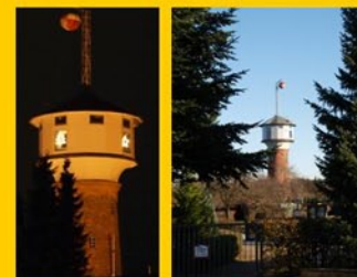
Der Wasserturm in der Weihnachtszeit / im Herbst